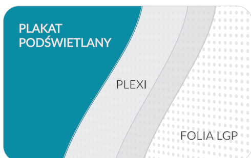
Przekrój warstw wkładu podświetlającego